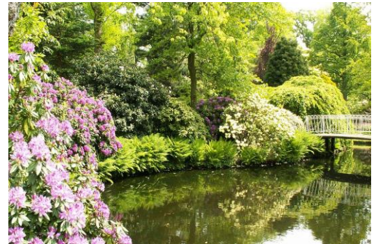
Arboretum, excursie D