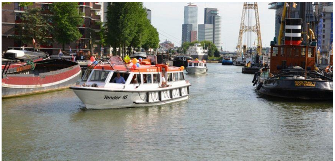
De Tenderboot in één van de Rotterdamse Havens Excursie C