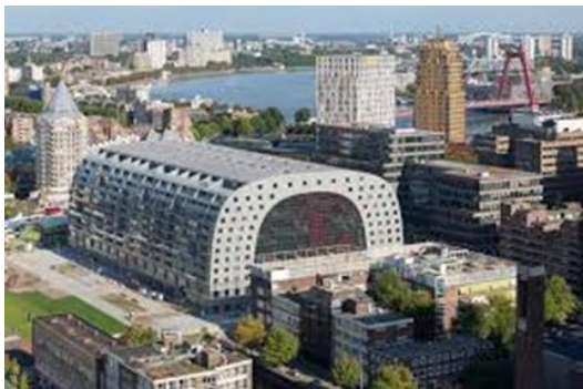
De Markthal, excursie B

Zoals u ziet is er een keuze uit vijf verschillende excursies. Elke activiteit duurt ongeveer 2 ½ uur. Direct na de lunch vertrekken we zodat iedereen op tijd voor de borrel terug is in het Excelsior stadion.