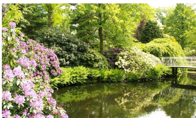
Arboretum. Excursie D.