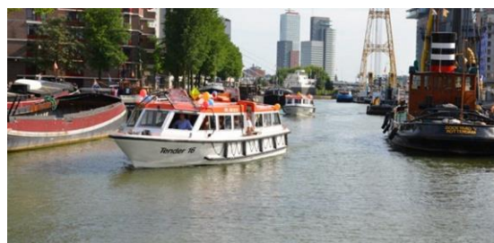
De Tenderboot in één van de Rotterdamse Havens ( C )

Dit schrijven is een vooraankondiging en dient om de datum van het Federatiefest in uw agenda te schrijven. Het is nog geen uitnodiging om u aan te melden. Dat kan ook administratief nog niet, we moeten nog enkele organisatorische zaken regelen voordat deze organisatie rond is. In de Uitnodiging die volgende maand rond gestuurd wordt, staat de datum vermeld waarop de deelnemersadministratie actief wordt. Dan dient u zich snel in te schrijven want hoe eerder u zich dan aanmeldt des te zekerder bent u dat uw keuze van excursie gehonoreerd wordt.