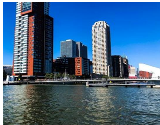
De Hoerenloper, de brug naar Katendrecht ( E )