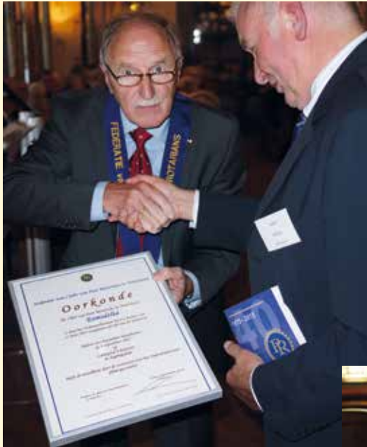
De oorkonde, daar was het om begonnen.

Eemsdelta is de naam van de nieuwe Club van Past Rotarians in Noordoost-Groningen, de vijfde in de provincie. De Club heeft een groot "verzorgingsgebied": alles ten oosten van de stad Groningen en ten noorden van de A-7.