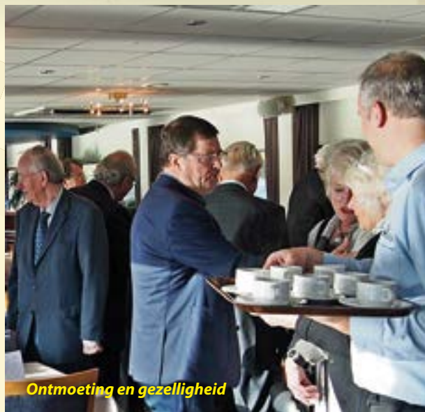
Ontmoeting en gezelligheid