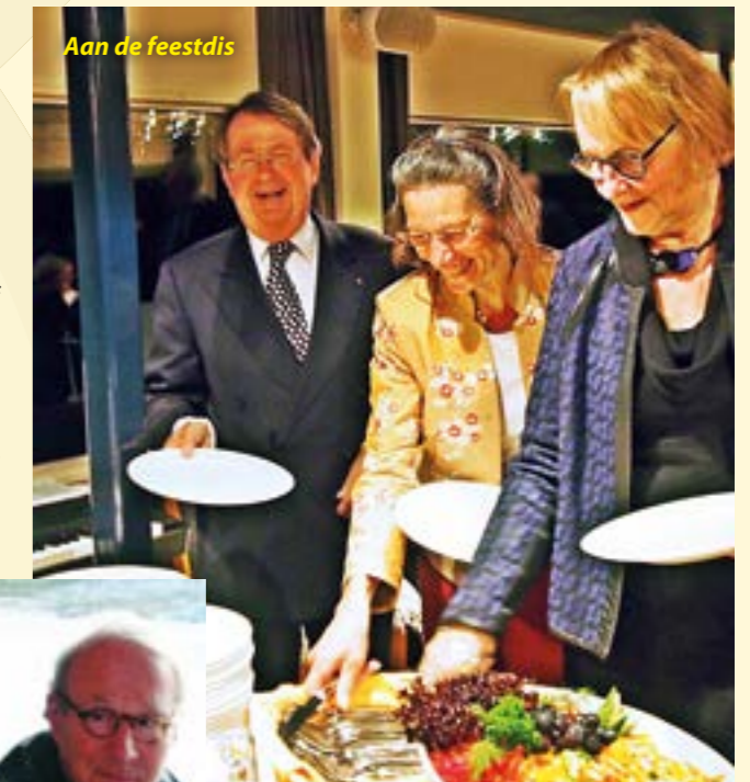
Aan de feestdis

Kortom: een genoegen voor de organisatoren om deze gezellige saamhorigheid gade te slaan.