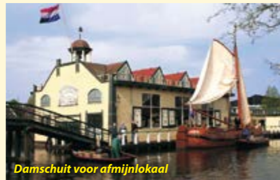
Damschuit voor afmijnlokaal

Het middagprogramma is onderverdeeld in drie excursie mogelijkheden, bestaande uit een drietal korte vaartochten door het Rijk der Duizend Eilanden met verrassend leuke tussendoortjes onderweg. Zoals het optreden van het shantykoor 'de Meedoiners' en het trio Eigenwijs en het aanmeren bij de oudste