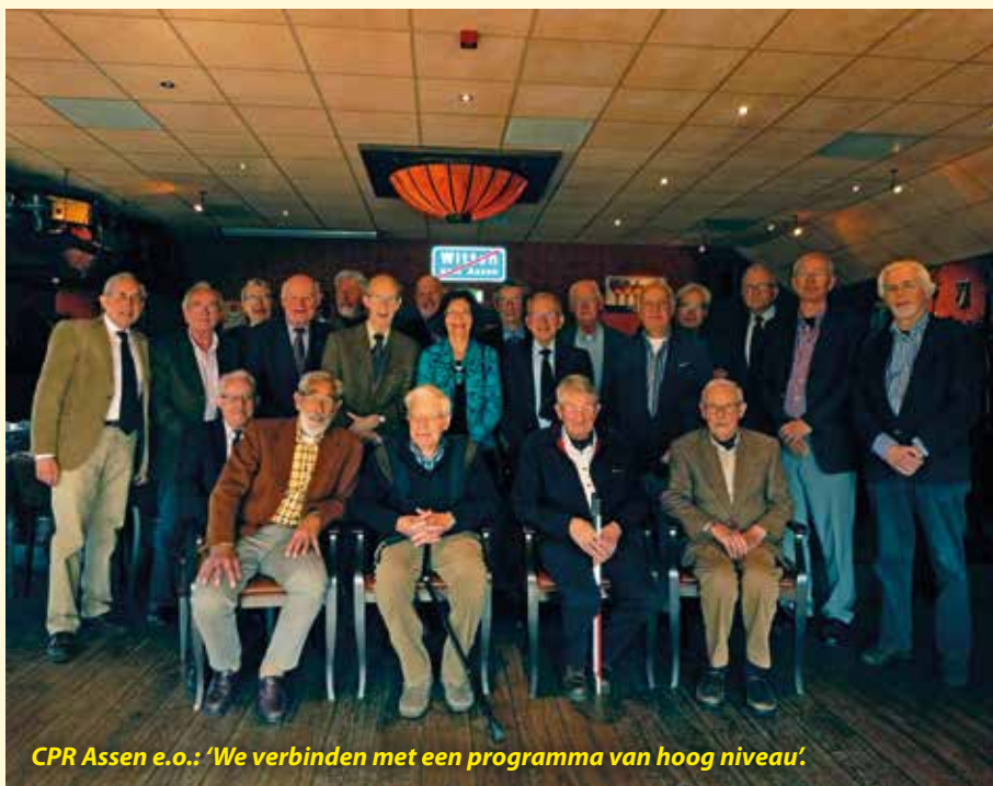
CPR Assen e.o.: 'We verbinden met een programma van hoog niveau'