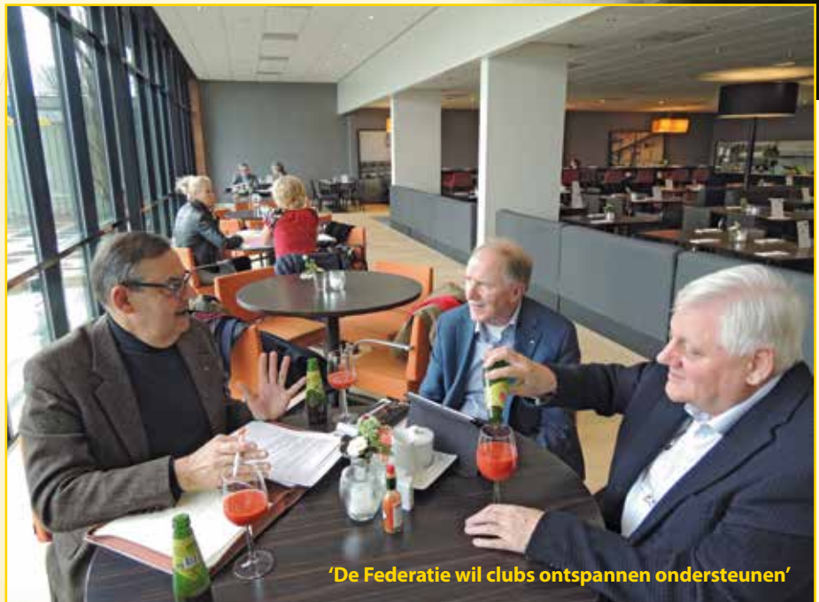
'De Federatie wil clubs ontspannen ondersteunen'