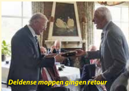
Deldense moppen gingen retour