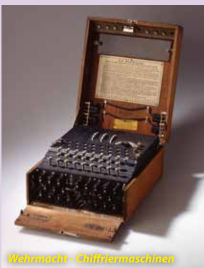
Wehrmacht - Chiffriermoschienen

Charmant onderdeel van het geheel was dat de partners van de vergaderende Past-Rotarians een bezoek konden brengen aan het nabijgelegen Bletchley Park.