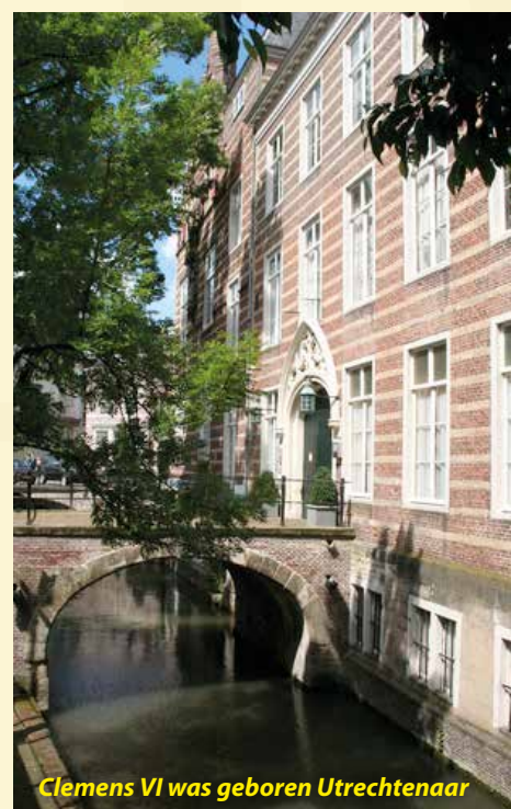
Clemens VI was geboren Utrechenaar