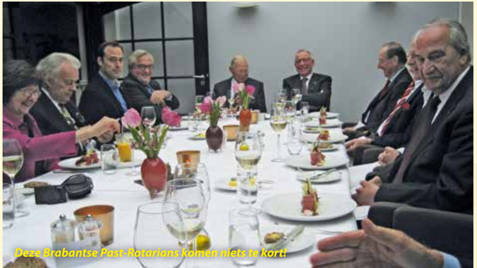
Deze Brabantse Past-Rotarians komen niets te kort!

Federatie-voorzitter Bosma refereerde tijdens de charter-uitreiking aan die eerdere bezoeken toen de club nog “in oprichting” was en toonde zich zeer verheugd de 118de club nu te mogen charteren en meldde dat er nog meer in zit, voordat hij halverwege dit jaar zijn periode als voorzitter afsluit. Hij prees PRC Best-Oirschot gelukkig met