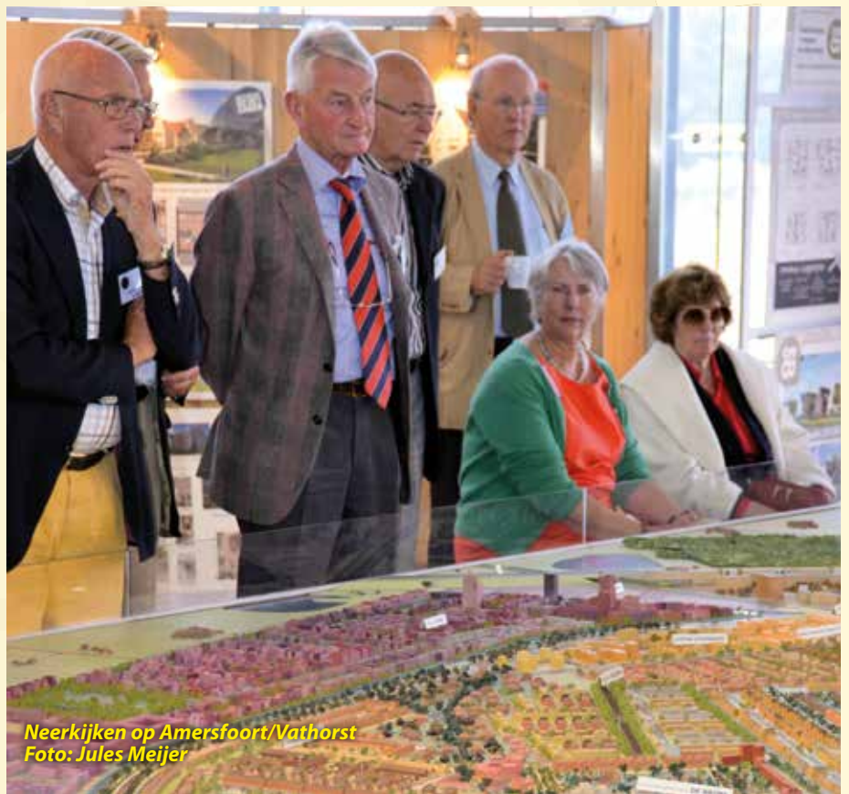
Neerkijken op Amersfoort/Vathorst