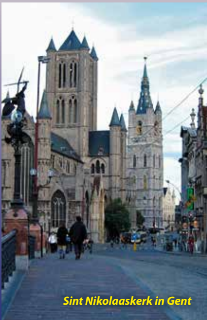
Sint Nikolaaskerk in Gent