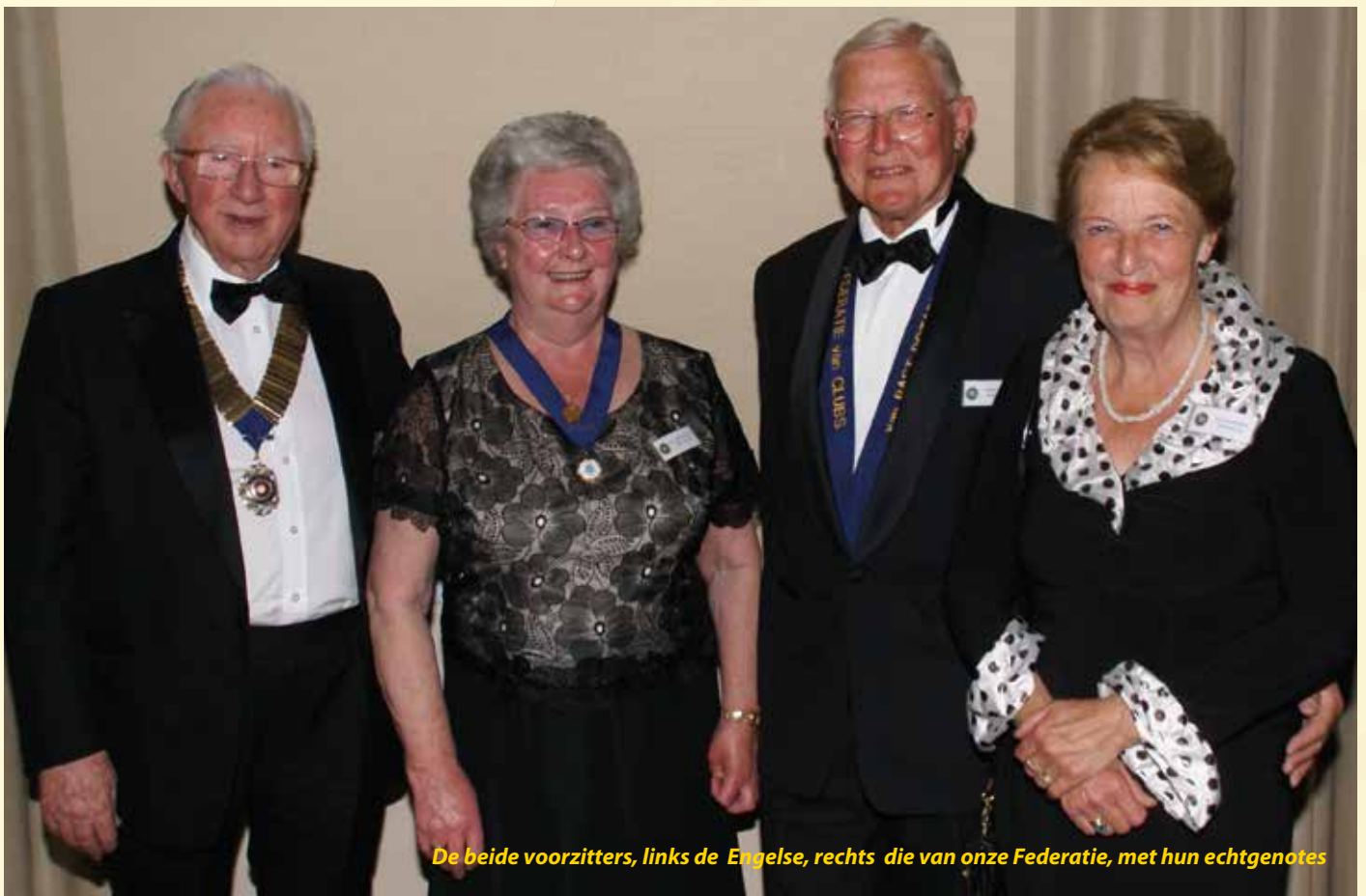
De beide voorzitters, links de Engelse, rechts die van onze Federatie, met hun echtgenotes