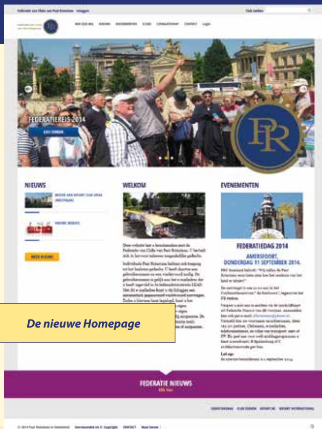
De nieuwe Homepage

taat geraken en de afstemming met Rotary ontstond bijna automatisch'.