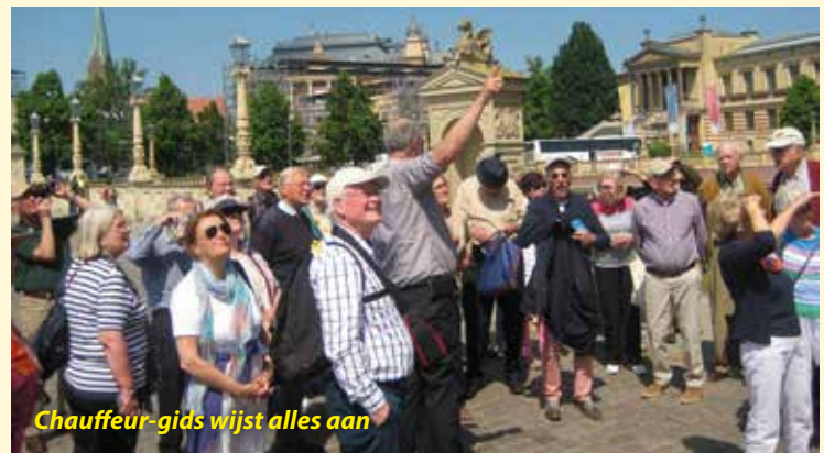
Chauffeur-gids wijst alles aan

die bijna gelijk Coventry ongelooflijk door de oorlog geleden heeft. Maar met de van onze Oosterburen bekende Tüchtigheit weer grotendeels van de immense verwoestingen is hersteld. Weer samengekomen bij vanwege de marsepein zo beroemde Niederegger, om van plaatselijke heerlijke zoetigheden te snoepen. De laatste dag voor de terugreis naar Hitzacker om het geboortehuis van Prins Claus te bezien, benevens een slecht gelijkend borstbeeld in het dorpje, waar verder weinig te zien was. Of het moest het gebrek aan uitzicht over de Elbe zijn omdat