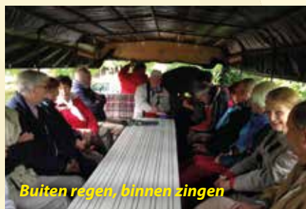
Buiten regen, binnen zingen

's Woensdags naar Schlagsdorf om te zien hoe het IJzeren Gordijn er voor de Wende heeft 'bijgehangen'. Want we vertoefden steeds, maar vooral dáár, in twee werelden: in voormalig Oost- en Westduitsland. Niet altijd opgewekt stemmend, maar voor velen weg erg interessant. Leuker was het bezoek aan Lübeck, waar twee gidsen de helft van de groep onder hun hoede namen voor een wandeling door de Altstadt. Om kennis te maken met het boeiend verleden van de stad