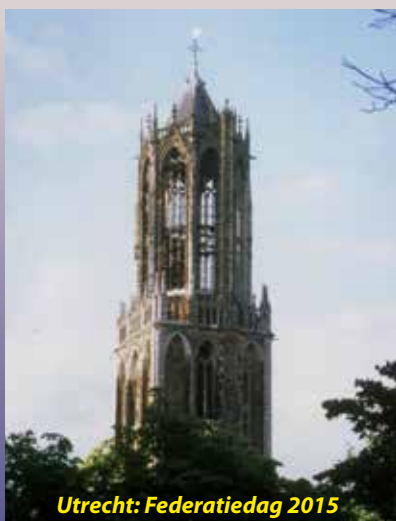
Utrecht: Federatiedag 2015

In de volgende uitgave van het Federatie Nieuws zal uiteraard aandacht worden besteed aan de Federatiedag in Stadskanaal. De datum (12 september) maakte het onmogelijk daaraan al in dit nummer aandacht te besteden.