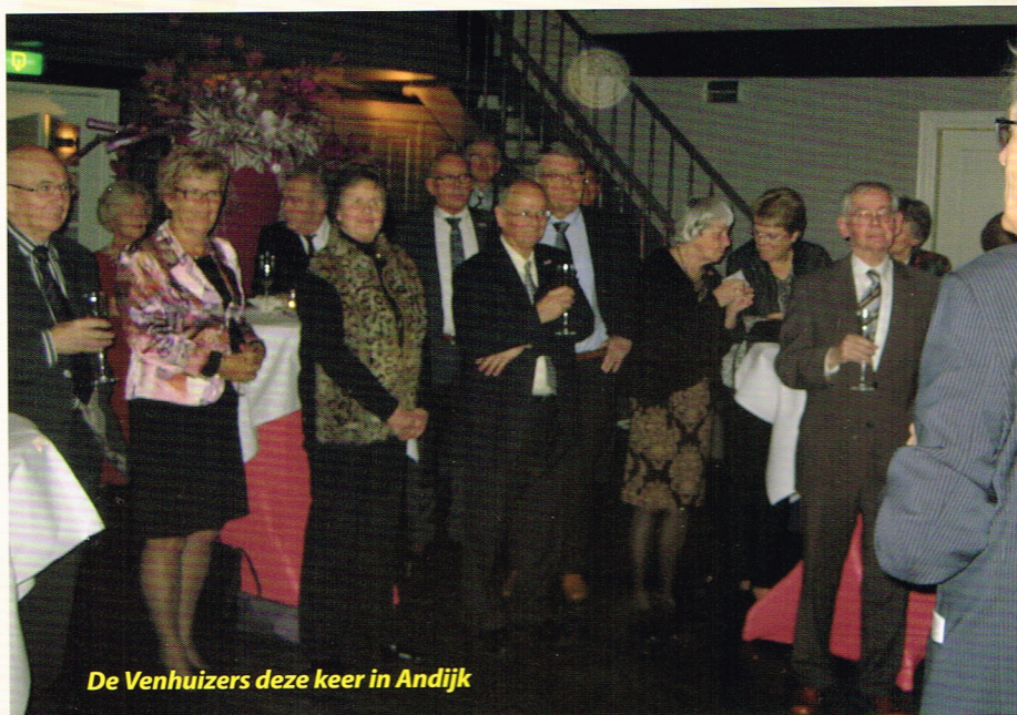
De Venhuizers deze keer in Andijk