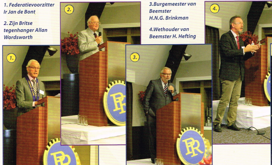
4. Wethouder van Beemster H. Hefting