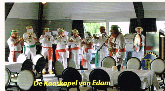
De Kaaskapel van Edam

bare feestelijke muziek van de Kaaskapel Edam. De geste van de burgemeester van Edam en Volendam en Katwoude, die zich de gelegenheid niet liet ontnemen om