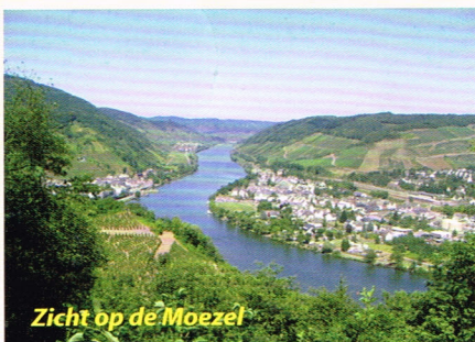
Zicht op de Moezel

De Federatiereis-2013 zal – hoogstwaarschijnlijk – wat minder ver van huis gaan dan voorgaande jaren. Voorlopig is de omgeving van de Moezel in Duitsland als bestemming gekozen. En een der eerste dagen van juni als vertrekdatum.