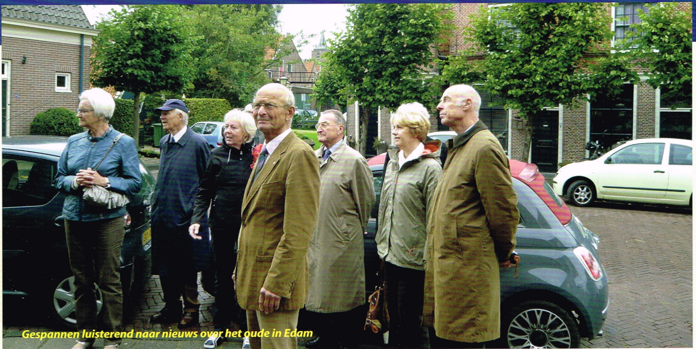
Gespannen luisterend naar nieuws over het oude in Edam

bonacci, kwam hij uiteindelijk bij de 28 meter hoge coöperatieve kaasfabriek van Cono uit, die het landschapscheppende werk van al die genoemde voorgangers absoluut niet aantastte "omdat die kolos daar zo prachtig in past". (Voor de bevestiging van die opvatting was enige fantasie onmisbaar maar ja, in die fabriek werd en wordt nu eenmaal de zo sterk gepropageerde Beemster-kaas geproduceerd.-red).