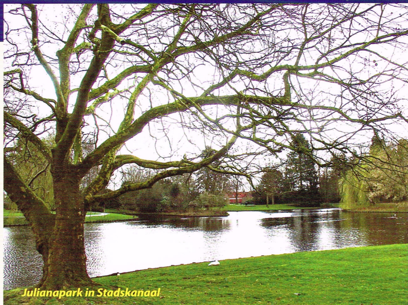
Julianapark in Stadskanaal