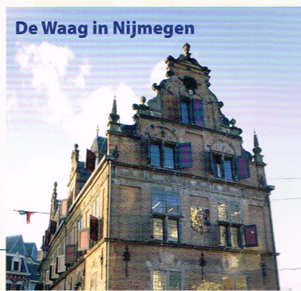
De Waag in Nijmegen

Het betreft Nijmegen, waar de met diezelfde naam getooide PRC zich vanaf 5 oktober vergezeld weet door de nieuwe club Nijmegen-Spijkerkwartier.