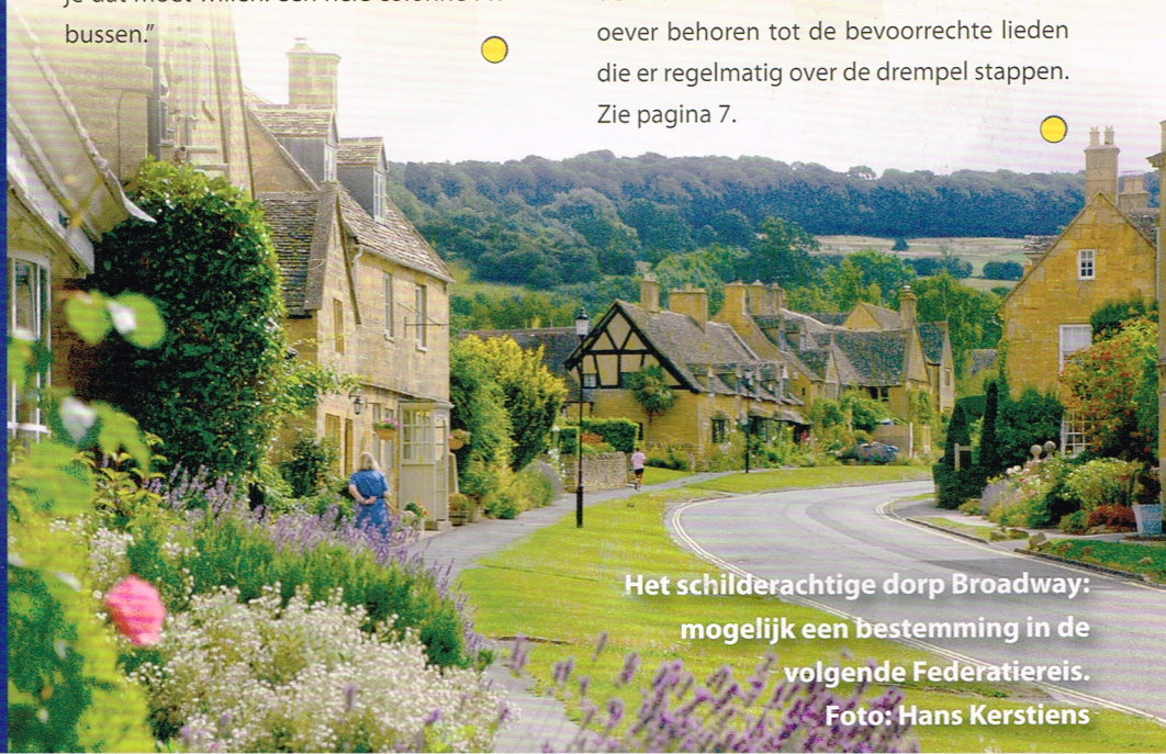
Het schilderachtige dorp Broadway: mogelijk een bestemming in de volgende Federatiereis.

Hij is ruim een eeuw oud: de voordeur van de sociëteit van de Koninklijke Roei- en Zeil Vereniging 'De Maas' in Rotterdam. De leden van de PRC Rotterdam Rechter Maasoever behoren tot de bevoorrechte lieden die er regelmatig over de drempel stappen. Zie pagina 7.