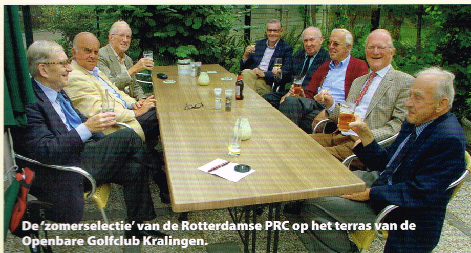
De 'zomerselectie' van de Rotterdamse PRC op het terras van de Openbare Golfclub Kralingen.

parkachtige 9 holes baan, goed toeven is en waar de keuken zeker niet onder doet voor die van 'de Koninklijke'.