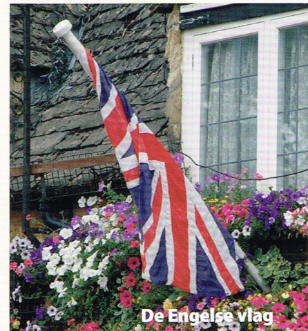
De Engelse vlag

De Engelse Past Rotarians hebben de vormgeving van hun website drastisch vernieuwd.