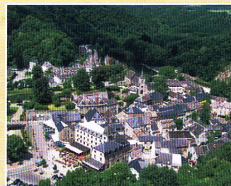
De Federatierijs voert ook naar het kleinste stadje van België: Durbuy.

Een aanmeldingsformulier kan worden aangevraagd bij de penningmeester van de federatie: Peter Kroesen, p-a.kroesen@planet.nl of 010-4342119. ●