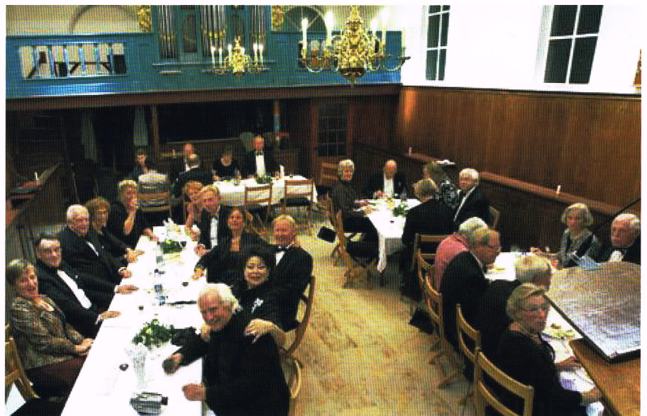
Een deel van het gezelschap, aan tafel in de voormalige schuilkerk de Vermaning.

voegde de voorzitter daar aan toe: “Doorgaans zijn Rotaryleden mannen. Vandaar dat onze club tot op heden geheel uit heren bestaat. Dames sluiten we zeker niet uit, maar ze moeten wel heel bijzonder zijn.”