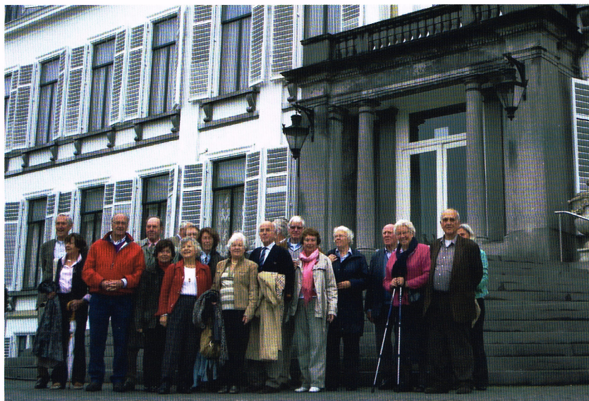
Leden van PRC Vecht en Venen lieten zich fotograferen aan de voet van het vermaarde paleisbordes.

Voor een gegidst bezoek aan Paleis Soestdijk moet tijdig gereserveerd worden. Dat kan - tot vier maanden in het voren - via de website www.paleissoestdijk.nl . Via de rubriek ‘Van harte aanbevolen’ attendeert het Federatienieuws clubs van Past Rotarians op originele excursie-bestemmingen. De redactie ziet suggesties met belangstelling tegemoet.