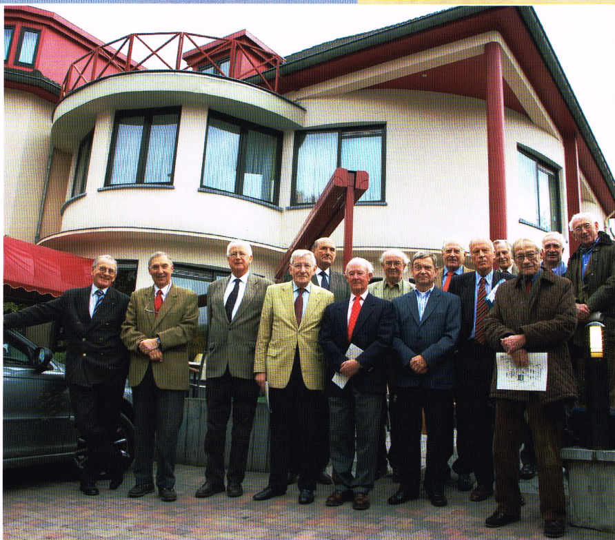
Leden van de PRC Maastricht, met op de achtergrond hun clubhuis.

Wie Maastricht verlaat en de loop van het riviertje de Jeker volgt rijdt even door een fraai dal. Volgens de site van Hotel Limburgia bevinden wij ons tussen de Sint Pietersberg en de Muizenberg. We passeren het enige terrassenkasteel van Nederland: hotel Château Neercanne, omringd door tuinen die Unesco-bescherming genieten.