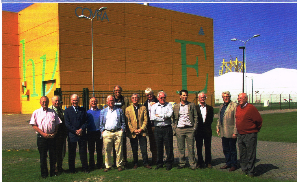
PRC Rijnwoude op visite bij 'Borssele'.

In discussies over energievoorziening lijkt kernenergie gaandeweg weer bespreekbaar te worden.