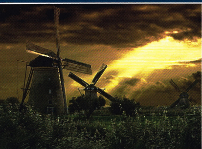
De molens van Kinderdijk.

Opnieuw staat de Federatie van Clubs van Past Rotarians een uitbreiding te wachten. Drie initiatiefgroepen hebben het federatiebestuur laten weten in aanmerking te willen komen voor de status van 'club in oprichting'. En het is niet denkbeeldig dat zich in de loop van dit jaar meer aspirant-clubs melden. Het bestuur van de Federatie heeft op het verzoek van Edam inmiddels positief gereageerd. Overleg vindt nog plaats over soortgelijke aanvragen vanuit Voorne-Putten en de West Alblasserwaard (Kinderdijk).