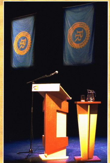
Federatienieuws en federatie-website bieden de clubs een uniek podium aan.

Het Federatienieuws biedt graag ruimte aan suggesties, zoals hier bedoeld. Stuur uw aanbevelingen naar de redactie via hanskerstiens@tiscali.nl .