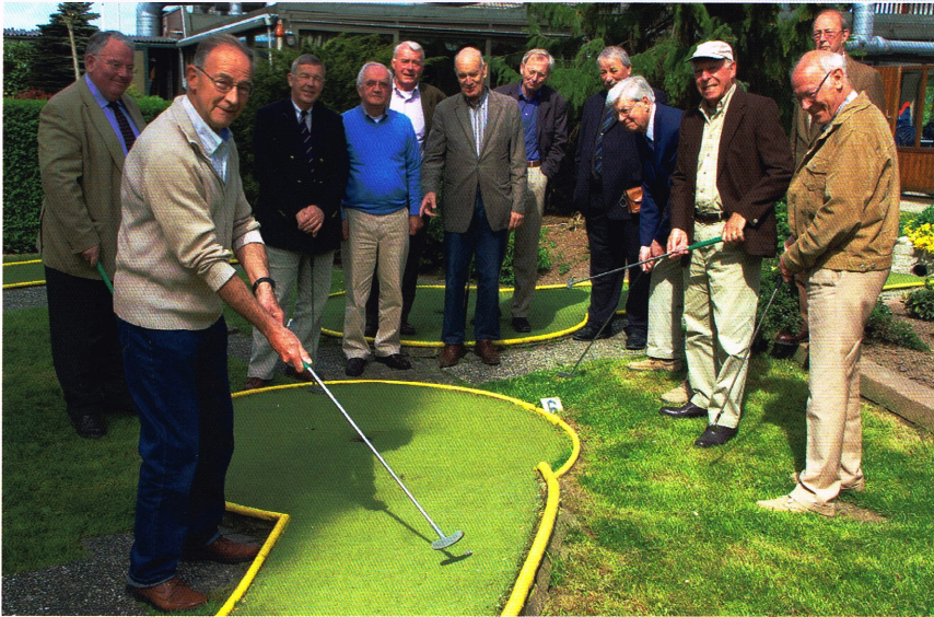
Een sportieve kiek van PRC Oost-IJsselmonde, gemaakt op de midgetgolfbaan.

De vloot van café-restaurant annex recreatieoord Het Theehuis, bestaande uit fluis-ter- en roeiboten, kano's en waterfietsen, ligt nog voor anker wanneer we ons voor een kennismaking met het home van de PRC Oost-IJsselmonde op een zomerse voorjaarsdag melden in het Zuid-Hollandse Rijsoord (gemeente Ridderkerk). Op de midgetgolfbaan worden al wel de eerste bal-letjes geslagen en in de speeltuin dwarrelt jeugdig bezoek rond. Kortom: het seizoen staat op uitbreken, daar aan de boorden van 't Waaltje.