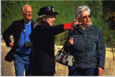
Een suppoost van Windsor Castle wijst Past Rotarians de weg.