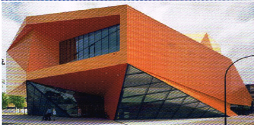
Het opvallende oranje exterieur van theater en congrescentrum Agora.

Het heet 'nieuw land' te zijn! Flevoland mag zich als provincie 'de jongste' noemen. Desalniettemin kunnen de IJsselmeerpolders bogen op een indrukwekkend verleden. En van de toekomst verwachten ze dat die een al even boeiende historie zal opleveren.