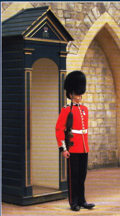
De erewacht bij Windsor Castle.

De deelnemers aan de Federatiereis verblijven in de universiteitsstad Oxford. Vervoer en organisatie van deze vier dagen durende trip naar Engeland is toevertrouwd aan Oad Reizen.