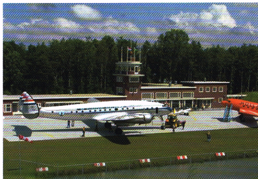
Op het Aviodrome werd het oorspronkelijke luchthavengebouw van het oude Schiphol steen voor steen herbouwd.

Na de lunch is het tijd voor het buitengebeuren! Federatiedag-deelnemers kunnen uit tal van excursiemogelijkheden kiezen. Het stadscentrum, dat nog volop in ontwikkeling is, vormt een uitnodigende bestemming. Niet minder dynamisch is het kustgebied, waar gaandeweg de contouren van een prominent 'waterfront' zichtbaar worden en waar ook de Bataviawerf en het factory outlet shopping centrum Bataviastad gesitueerd zijn. Natuurliefhebbers kunnen kennis maken met de Oostvaardersplassen. En op vliegveld Lelystad zijn de Past Rotarians welkom in het Nationaal Luchtvaart-Themapark Aviodrome.