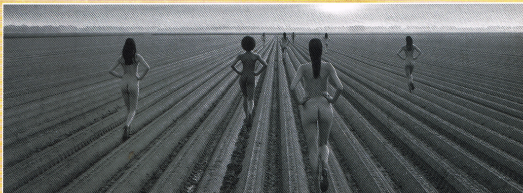
Het Flevolandse landschap is verrassend, maar dit beeld is toch echt een illusie.