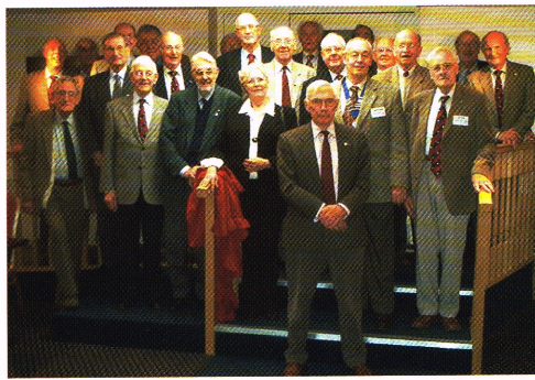
Eén Vrouw en enkele Heeren van Voorne, in gezelschap van hun Britse gastheren.

De ontvangst was hartelijk; wij werden in Hull zelfs met een spandoek welkom geheten.