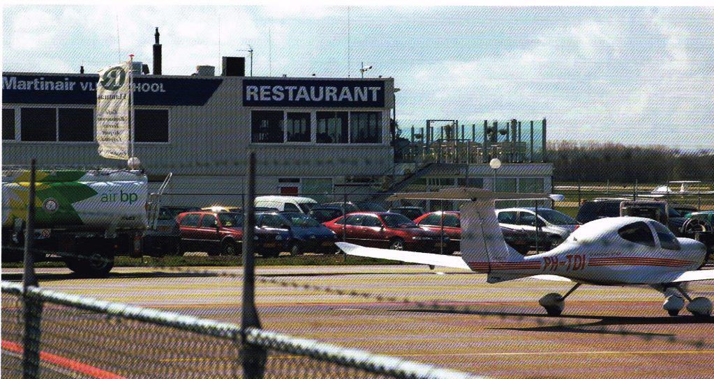
Het clubhuis van PRC Lelystad-Insula Flevum ligt pal naast het platform van Lelystad Airport.

Café-restaurant-terras Flantuas, Lelystad Airport, Emoeweg 4, 8218 PC Lelystad, tel. 0320.288230, www.flantuas.nl PRC Lelystad-Insula Flevum komt bijeen op de 1e en 3e dinsdag van de maand, van 11.30 tot 14.00 uur.