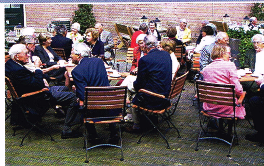
Leden van PRC Kennemerland met hun partners in de tuin van het Koetshuis van kasteel Keukenhof.

Op 20 mei kwamen de leden en hun partners bijeen in het Koetshuis van Kasteel Keukenhof te Lisse. Ter verhoging van de