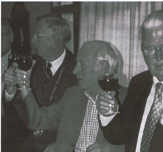
De toast na de installatie.

De tijd hierna wordt ingevuld met een zeer geanimeerd diner, waarin de leden de onderlinge banden, voor zover deze er al niet zijn, aanhalen. Het belooft alle goeds voor de toekomst.