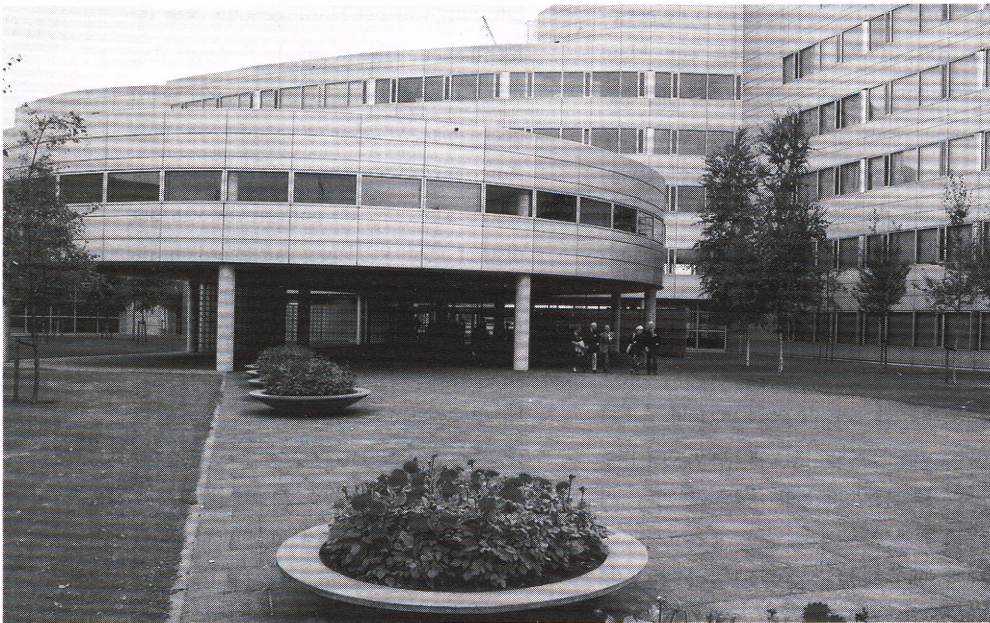
Atrium van Hoofdgebouw Schiphol.

gen. Voor 2004 worden nog gegadigden tegemoet gezien, zo sprak hij. Hij wens- te iedereen een goede dag toe en hij verbond daaraan de wens, dat hij een ieder volgend jaar weer mag ontmoeten.