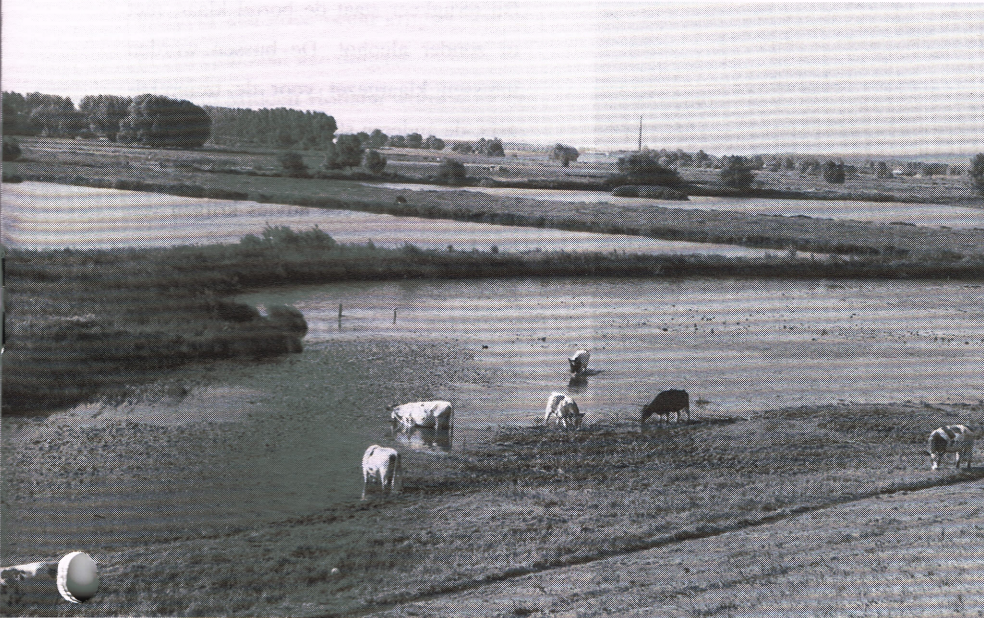
De Gelderse Poort, Nijmegen

liefst 1900 jaar en is daarmee ouder dan alle andere stadjes en steden in ons land, waaronder zelfs Maastricht. De Federatiedag is dan ook een beetje een voorloper van een groots feest dan binnenkort rond deze Waalstad wordt gevierd.