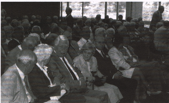
Opening op 12 mei van Federatiedag (Provinciehuis Den Bosch)

Allengs moesten de terrasjes worden gelaten voor wat zij zijn omdat het Gemeentebestuur in het historisch stadhuis een ontvangst aanbod. Einde van een gezellige, interessante en zoals gezegd perfect georganiseerde Federatiedag. (FP)