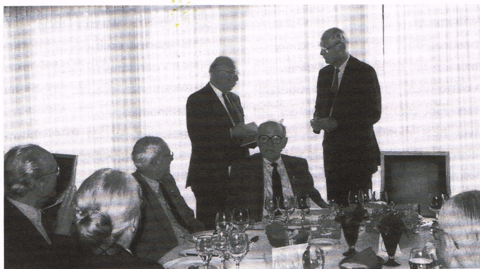
PRC Den Haag viert elk jaar z'n verjardag met een heerlijk diner (1998)

Geruchten over PRC's in Scandinavië en in Latijnse landen (Zuid Europa) vinden alleen steun in een Spaanse installatie in de 80er jaren