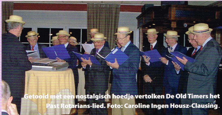
Getooid met een nostalgisch hoedje vertolken De Old Timers het Past Rotarians-lied.

Mocht een club van Past Rotarians belangstelling hebben voor tekst en notenbeeld, dan kan contact worden opgenomen met a.j.ingenhouz@misc.utwente.nl . 😊